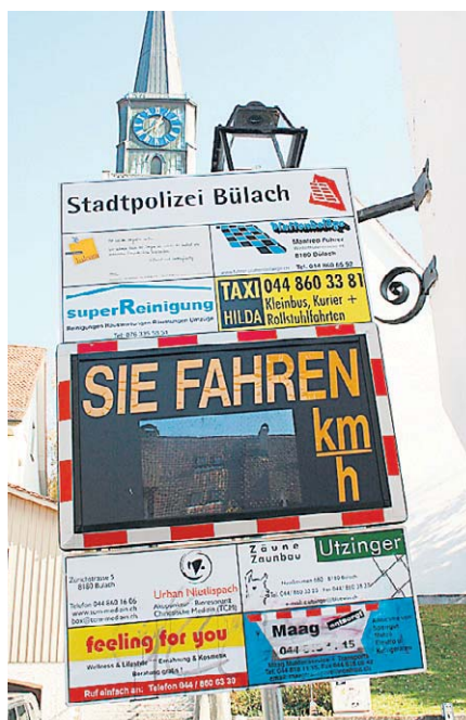
Tempoanzeige mit Werbung in Bülach (l.), reklamefreies Gerät in Oberglatt.

Geschwindigkeitsmessgeräte über Werbung zu finanzieren, damit verdient die Firma PMS Öffentlichkeitsarbeit GmbH in